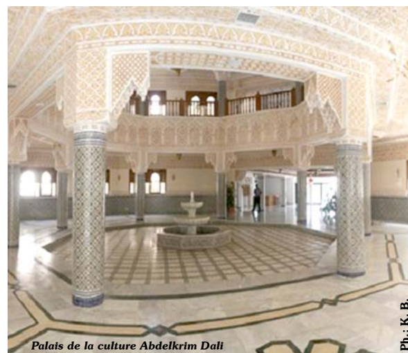
Palais de la culture Abdelkrim Dali

Les arts plastiques donnent le goût de l'expression personnelle et de la création. Ils permettent de découvrir des œuvres dans la diversité des genres, des styles et des périodes. Ils apportent les moyens de comprendre la nature des faits artistiques repérables dans la création en arts plastiques, en architecture, dans