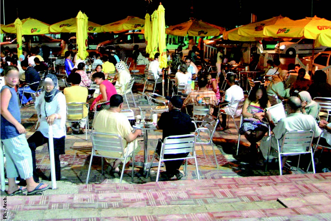
El Kebir A. & L.T.

Comme chacun le sait, en cette période où la canicule atteint des sommets, sauf pour ce qui concerne la plage, ce n'est pas aux alentours de 14h que les Oranais se plaisent à sortir dans les rues, histoire de se rafraîchir. En vérité, c'est seulement à partir de la tombée de la nuit que les rues d'Oran, au lieu de se dépeupler, se mettent petit à petit à grouiller de gens.