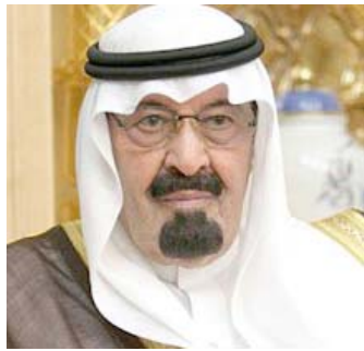
SALMANE, TOUT NATURELLEMENT

En dépit de la chute des cours à la fin 2014, il a maintenu le rythme des dépenses dans le budget 2015 pour préserver la paix sociale. Et, surtout, il aura défendu un cours du brut bas, avec le maintien du plafond de production de l'OPEP, pour déstabiliser les producteurs non-Opep, quitte à provoquer des pertes collatérales. Né en 1923 à Ryad, Abdallah était le 13 e fils du roi Abdel Aziz, fondateur du royaume d'Arabie Saoudite.