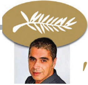
DE NOTRE ENVOYÉ SPÉCIAL À CANNES : TEWFIK HAKEM