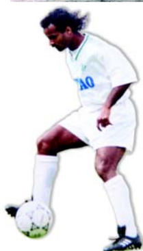
Relanceur de balles infatigable