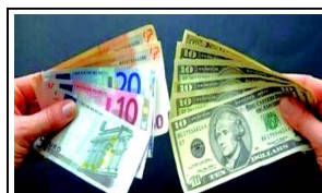
Cotations hebdomadaires des billets de banque et des chèques de voyage