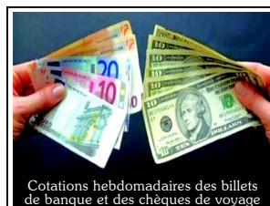
Cotations hebdomadaires des billets de banque et des chèques de voyage