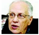
Par Belkacem Ahcene- Djaballah