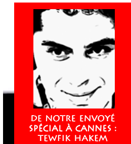
DE NOTRE ENVOYÉ SPÉCIAL À CANNES : TEWFIK HAKEM