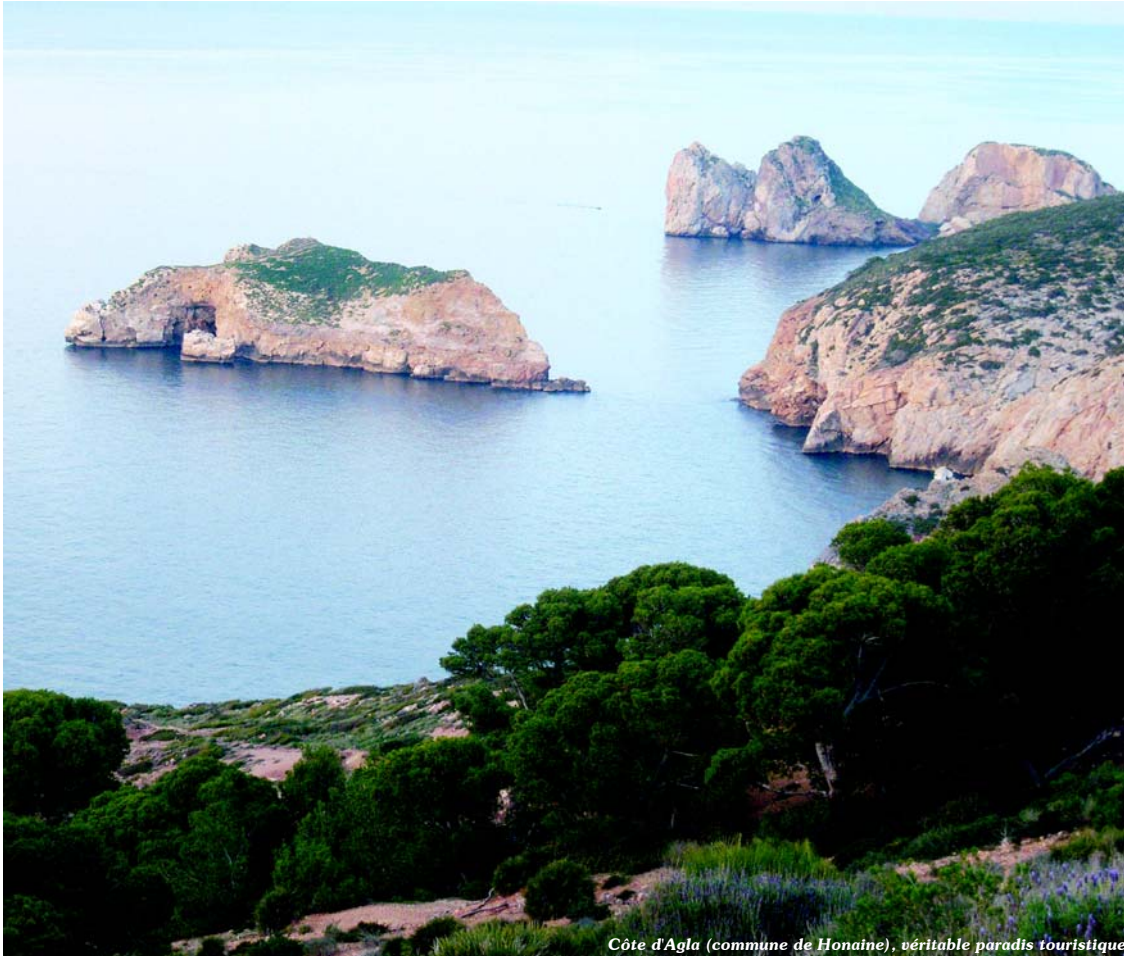
Côte d'Agla (commune de Honaine), véritable paradis touristique