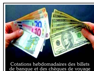
Cotations hebdomadaires des billets de banque et des chèques de voyage