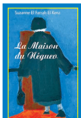
LA MAISON DU NEGUEV. Une histoire palestinienne. Un recueil de souvenirs de Suzanne El Farrah El Kenz. Apic Editions, Alger 2009, 159 pages, 400 dinars

En somme, en adoptant une politique qui favorise l'unité, respecte l'indépendance nationale et promeut la résolution pacifique des conflits, les pays africains peuvent établir les bases d'un développement durable. Ces principes sont non seulement essentiels pour la croissance économique, mais également pour la construction d'une Afrique unie, forte et prospère.